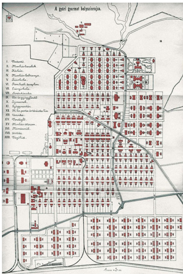
3. ábra. A Diósgyőri M. Kir. Vas- és Aczélgyár gyarmatának helyrajza (1910)

A helyi sajtó 1913-ban szemléletesen mutatja be a lakótelepet: „Legnagyobb büszkesége Miskolcznak és Borsodmegyének a diósgyőri vas- és aczélgyár, mely az egyedüli része Magyarországnak, hol igazi amerikai gyorsasággal, úgyszólván a szemünk láttára nő és fejlődik minden hatalmassá. Utcái száz évvel előzték meg rendezettség és tisztaság tekintetében Miskolcz utcáit, úgy, hogy minden miskolczi ember irigységgel vegyes reményekkel gondol arra: mikor lesznek Miskolcz utcái ilyen rendezettek. Amikor a Vasgyártelep rendezett utcáin elhalad az ember, önkéntelen is az a megelégedettség hatja át lelkét, hogy a gyár tüzes kohói mellett, idegölő és testet sorvasztó műhelyekben dolgozó munkászereknek olyan valamiben van részük, amiért nemcsak a kisvárosi, de még a nagyvárosi ember is méltán megirigyli őket: van rendesen épített, egészséges lakásuk, kis kertjük, ahol munka után igazán édes a pihenés.”