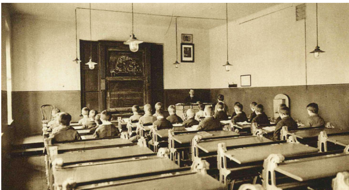
6. ábra. Iskolai tanterem

Az első elemi iskola a vasgyári lakótelepen már 1868-ban megalakult, Percesen pedig 1884-ben. Kisdédővő a vasgyári lakótelepen 1886-tól működött. 1896-ban a gyárigazgatóság átvette az iskolák kezelését, a