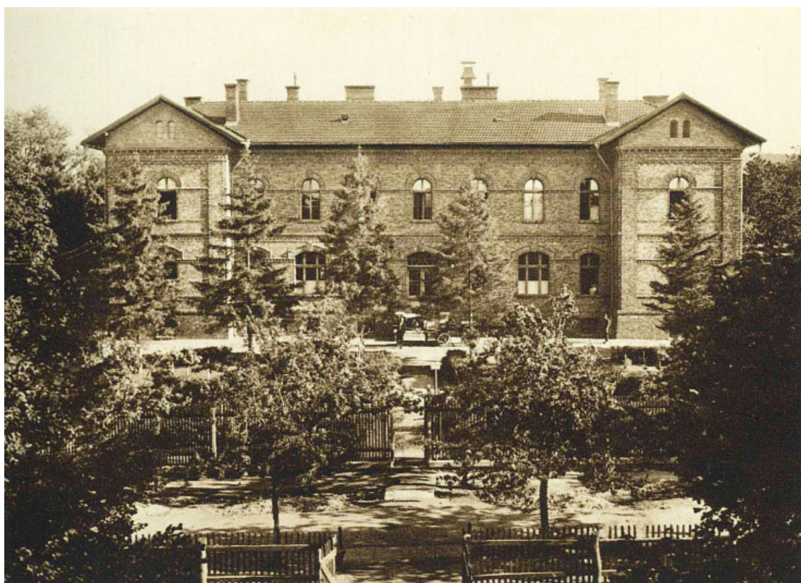
4. ábra. Kórház. Tíz orvos állt a betegek rendelkezésére

A diósgyőri gyár összes alkalmazottainak és munkásainak gyógykezelését a gyártelepen 6, Peczesen 1, Miskolczon 2, Diósgyőrben, Nagybátonyban és Ormospusztán 1-1 orvos látja el.