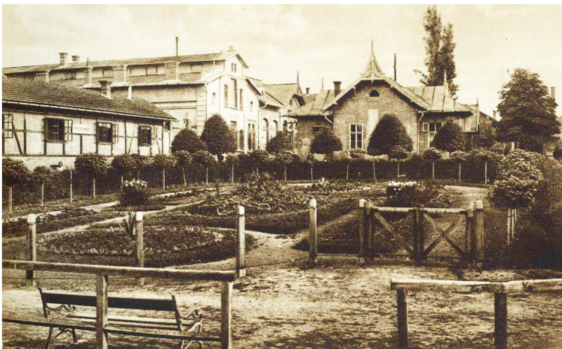
5. ábra. A Fogyasztási Szövetkezet és a tejszarnok

ságában földterületet béreltek a helyi földbirtokosoktól, amelyeket 300–500 m 2 -es parcellákban, mérséklet áron adták bérbe konyhakerti és kapásnövények termesztésére. 1921-ben már kétezerkétszáz gyári alkalmazott bérelt „kiskert”-et, ezek egy részén családi házakat építettek az alkalmazottak és munkások. A gyár erdőrészt is bérelt, amelyet kirándulóhelynek rendeztek be „Herrmann Miksa-telep” néven.