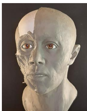
5. ábra: A jobb arcfél rekonstruált izmait már bőr borítja, a bal arcfélen még láthatóak a mimikai izmok rétegei: a száj fő tömegét alkotó száj körüli gyűrűs izom (m. orbicularis oris) és a szájba sugárzó mimikai izmok (felülről: m. levator labi superioris alaeque nasi, m. zygomaticus minor et major; alulról: m. mentalis, m. depressor labi inferioris, m. depressor anguli oris; fotó: Kustár Ágnes).

Fig. 4: a) The spines fixed on the plastic copy of the skull mark the thickness of the soft tissue. The eyes were replaced with plastic eyeballs, while the cartilaginous nose made of wax (photo: Ágnes Kustár); b) the masticatory muscles, the upper lip and the outer nose were modeled from plasticine (photo: Dániel Gerber).