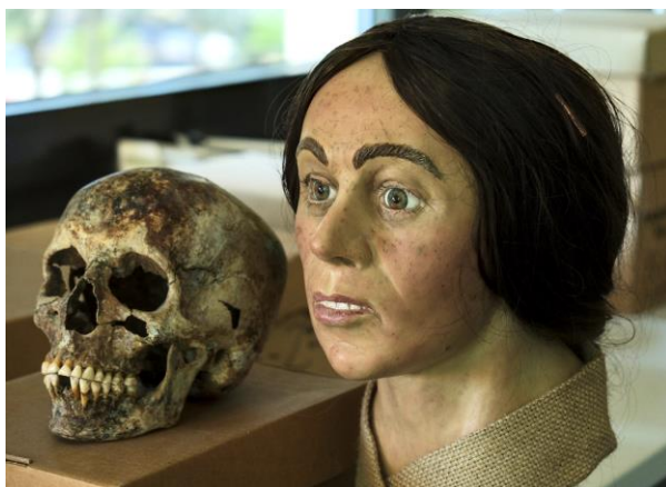
7. ábra: Az arcreekonstrukció élethűen színezett gipszöntvénye parókából készített hajviselettel, mellette az eredeti koponyával (színezés: Herceg Zsuzsa).

Fenotípusos jellemzők: szemszín, hajszín és a bőr színtónusa. A genetikai adatok kreolos tónusú, szeplős bőrre és világos árnyalatú kékes szemekre utalnak, több barnás pigmenttel. A szemeket, az élethű bőrszínezést és a haj rekonstrukcióját ennek megfelelően Herceg Zsuzsa restaurátor készítette el (7. ábra). A hajviseletet a korabeli női viseleti ábrázolásoknak megfelelően a kerámia szobrocskákön látható (Kiss 2019) hajfonattal, sötétebb tónusú szőkésbarna parókából alakítottuk ki.