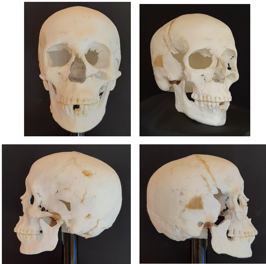
3. ábra: Balatonkeresztúr-Réti-dűlő, 13. sír, bronzkori nő 3D műanyag koponyamásolata elől-, félprofil- és oldalnézetben.

károsítja a csontokat. A koponyáról a Semmelweis Egyetem Orvosi Képző Klinikáján készítettünk CT (Computer Tomográf) felvételt, majd a digitális adatokból rekonstruált virtuális térbeli koponyamodell alapján a műanyag másolatot a Varinex Zrt. készítette el SLS (Szelektív Lézer Színterezési) technológiával (3. ábra)