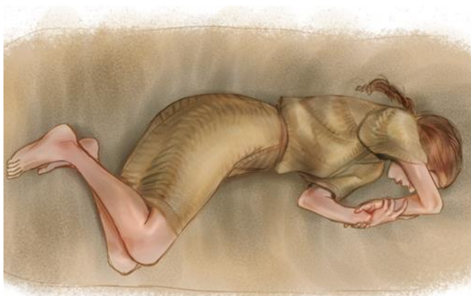
2. ábra: Balatonkeresztúr-Réti-dűlő, 13. sír rekonstrukciós rajza (készítette: Gerber Fanni). Fig. 2: Reconstructive grave drawing (made by Fanni Gerber), Balatonkeresztúr-Réti-dűlő, grave 13.

jellegzetes fejdísz- vagy sapkaviseletéhez tartoztak (Költő 2004, Somogyi 2004, 2007), de lemezből vagy drótból csavart fémcsővecskéket nyakláncként felfűzve vagy ruhára varrva is viseltek (Szabó 2010).