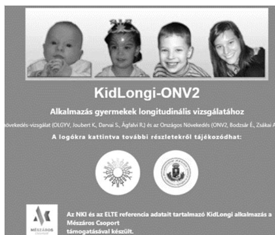
1. ábra: A KidLongi - ONV2 szoftver nyitó oldala a kidlongi.hu felületen. Fig. 1: The opening site of the KidLongi - ONV2 software at kidlongi.hu .

A gyermekek növekedésével és érésével foglalkozó orvosok, védőnők és más tudományterületeken auxológiai kutatásokat végző szakemberek munkájának segítésére készítettük el a KidLongi - ONV2 szoftvert. A felhőből letölthető alkalmazás mindenki számára ingyenesen elérhető a kidlongi.hu (1. ábra) felületen történő regisztráció után. Mind számítógépeken futó, mind pedig mobil telefonokon alkalmazható formában is elérhető.