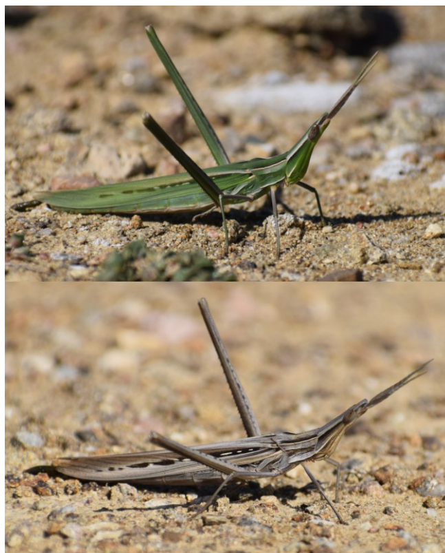
1. ábra. A sisakos sáska zöld és barna színváltozata a Nyugat-Mecsekben (Kővágószőlős, Kajdacs). Figure 1. Green and brown color variations of Acrida ungarica from Kővágószőlős (Mecsek Mts).

2019 augusztusában és szeptemberében botanikai valamint faunisztikai vizsgálatokat végeztünk a Villányi-hegység és a Mecsek területén. A sisakos sáska példányok észlelése vizuális megfigyeléssel és fűhálós rovargyűjtéssel történt. Mivel egyértelműen azonosítható, de védett és lokálisan ritka fajról van szó, a példányok nem kerültek begyűjtésre, bizonyító erejű fényképek azonban készültek róluk (1. ábra).