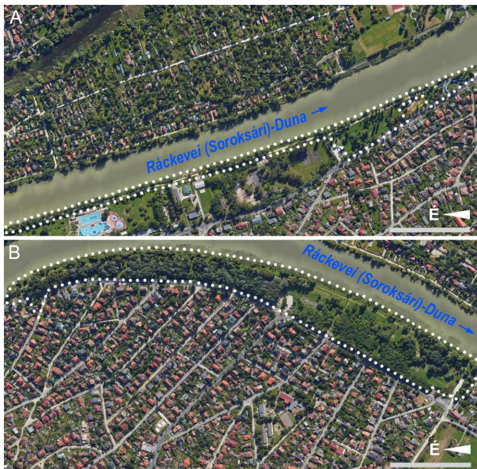
1. ábra. A vizsgált terület műholdképen, fehér pontsorral lehatárolva. A: a terület északi fele; a soroksári rév csepeli kikötője a kép jobb szélén látható. B: a terület déli fele; a soroksári rév csepeli kikötője a kép bal szélén látható. Méretlécek (szürke vonalak): 200 m.

Lepkészeti nevezetességei ellenére még nem született összefoglaló mű Csepel lepkéiről; eddig csak szórványadatokat közöltek (pl. KOVÁCS 1953, 1956). A jelen munkának sem célja elkészíteni a csepeli lepkéfauna alapvetését, azonban az utóbbi években olyan faunisztikai érdekességek kerültek elő, amelyeket közlésre érdemesnek tartok. Továbbá itt szeretném közreadni azokat az általam gyűjtött példányokkal alátámasztott előfordulási adatokat, amelyek a csepeli molylepkéfaunára vonatkoznak.