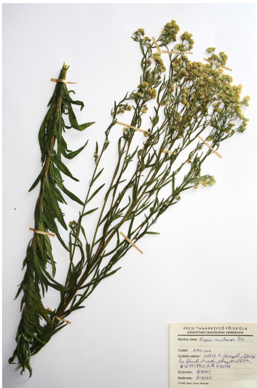
Fig. 2. Herbarium specimen of Erigeron sumatrensis collected at Siklós-Máriagyűd.