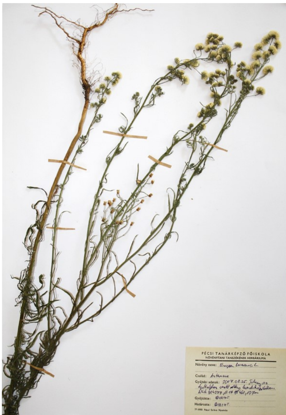
Fig. 1. Herbarium specimen of Erigeron bonariensis collected in Tihany.