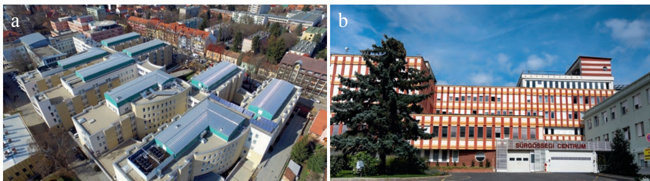
10. a, b ábra

A második mérföldkő osztályunk életében a kórházi főépületbe való költözésünk, és ezt az új kórházi tömb építése tette lehetővé. Már évtizedes törekvés volt a kórház vezetése részéről, hogy a régi pavilon-rendszert felszámolva, gazdaságosabb, egy tömbben megvalósuló kórházat hozzon létre. Ezt Dr. Repa Imre akkori kórházigazgató váltotta valóra, s a megmaradt pavilonok is összekötésbe kerültek a főépülettel. Osztályunk az Északi tömb 1. szárny 2. emeletére, a szakrendelések pedig a földszintre költöztek. Eszközparkunk bővülése – CO2 laser, soft laser, fényterápiás eszközök, dermatoscopok, digitális fényképezőgép – az új tömbbe való költözésünkhöz köt-