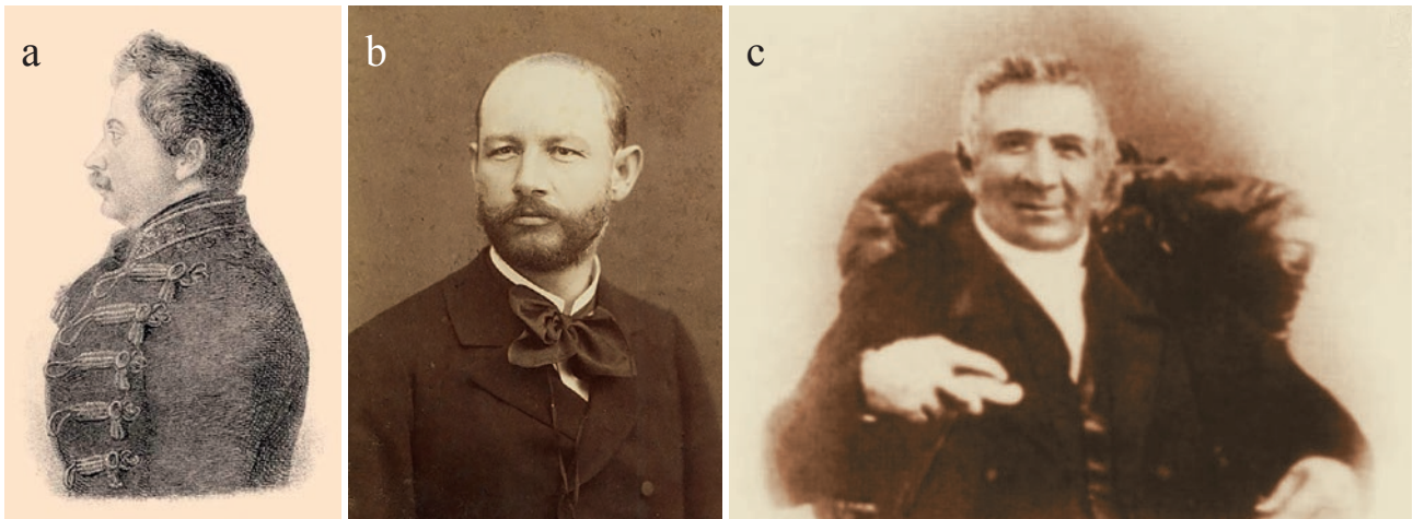
1. a, b, c ábra