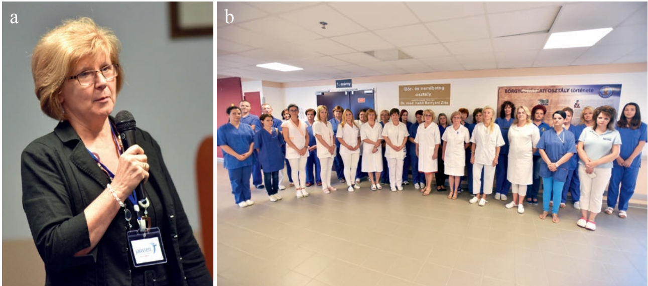
11. a, b ábra

Szakmai rendezvény a Bőrgyógyászati osztály 140. évfordulója alkalmából (2016)