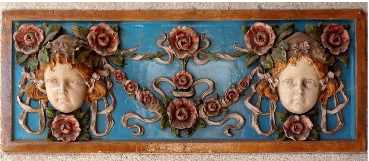
2. ábra A Menhely főépületét díszítő Zsolnay-dísz

A Menhelynek kettős feladatot kellett ellátnia: gondoskodott ez egészséges csecsemők és gyermekek ellátásáról mindaddig, míg azok vidéki nevelőszülőkhöz nem kerültek. Ezen feladatra ún. „Transzport osztályokat” létesítettek. A beteg, alultáplált gyermekek pedig a kórházi részleg lakói lettek felgyógyulásukig. Ez 170 ágyas belgyógyászati, 40 ágyas sebészeti és 17 ágyas fertőtlenítő