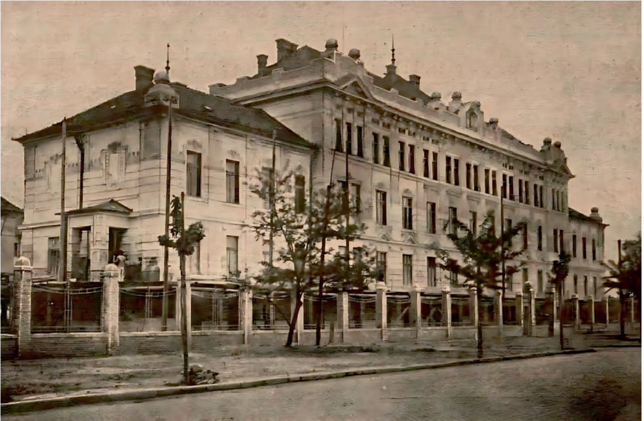
1. ábra A Menhely főépülete

A fővárosi gyermekmenhely központi és országos adminisztrációs feladatot is kap, épületét Ybl Lajos tervei alapján a főváros által ingyenesen felajánlott, Orczy út – Üllői út szöglettelken építik fel (1., 2. ábra). A 6 pavilonból álló intézetbe már 1907-ben megtörténik a beköltözés, de a hivatalos átadásra csak 1908. június 4-én kerül sor, Andrássy Gyula belügyminiszter jelenlétében.